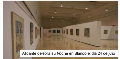
Alicante celebra su Noche en Blanco el día 24 de julio